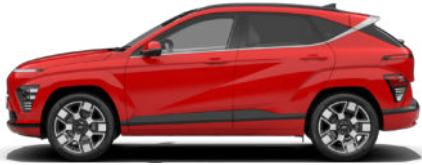
Engine Red Solid